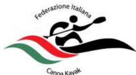
FEDERAZIONE ITALIANA CANOA KAYAK