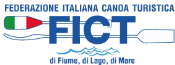
FEDERAZIONE ITALIANA CANOA TURISTICA