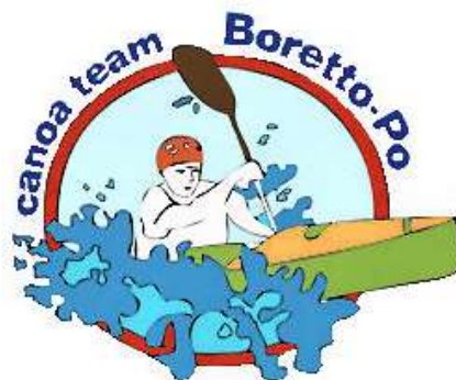
CANOA TEAM BORETTO PO